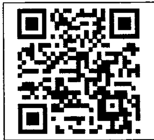
รายละเอียดโครงการ