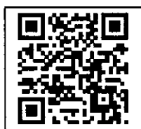
รายละเอียดโครงการ