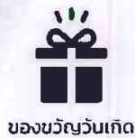
ของขวัญวันเกิด