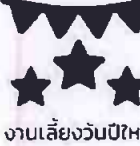
งานเลี้ยงวันปีใหม่