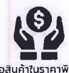
ซื้อสินค้าในราคาพิเศษ