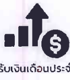
ปรับเงินเดือนประจำปี