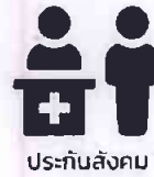
ประกันสังคม