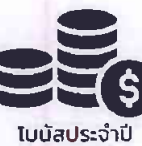
โบนัสประจำปี