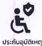
ประกันอุบัติเหตุ