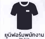
ยูนิฟอร์มพนักงาน Uki 3 Co