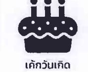
เค้กวันเกิด