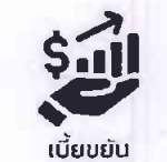
เบี้ยขยัน