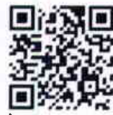
:ขั้นตอนการสมัครสอบ และชำระเงิน