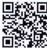
:ช่องทางการสมัคร