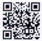
:ช่องทางส่งเอกสาร ประกอบการสมัคร