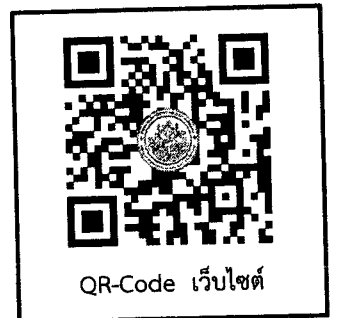
QR-Code เว็บไซต์

หมายเหตุ : ๑) เจ้าหน้าที่ฝ่ายรับสมัครจะประสานทางโทรศัพท์เพื่อยืนยันการจัดอบรมก่อนถึงกำหนดการอบรมจริง ๑ - ๒ สัปดาห์ ๒) กรณีผู้เข้ารับการอบรมจะดำเนินการชำระเงินค่าที่พักและค่าเดินทางล่วงหน้า ต้องได้รับการยืนยันดำเนินการจัดอบรมจาก เจ้าหน้าที่แล้วเท่านั้น หากไม่ได้รับการยืนยันจากเจ้าหน้าที่ถือว่าไม่มีการดำเนินการจัดฝึกอบรมในหลักสูตรนั้น ๆ ผู้เข้าอบรมจะ ไม่สามารถขอรับเงินค่าที่พักและค่าเดินทางคืนจากทางมหาวิทยาลัยได้ ๓) ขอสงวนสิทธิ์การเข้าฟังบรรยายสำหรับผู้เข้ารับการฝึกอบรมที่ผ่านการลงทะเบียนกับทางมหาวิทยาลัยเท่านั้น