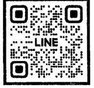
QR-Code ลงทะเบียนอบรม QR-Code เพื่อสอบถามข้อมูล